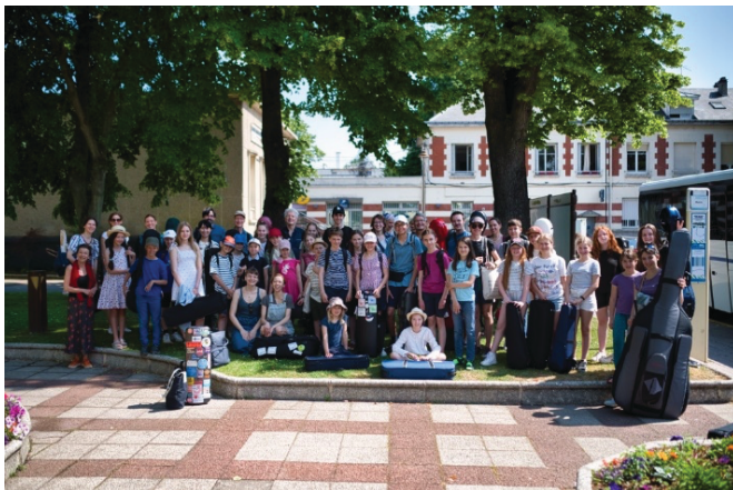
Austauschschüler der KMS in Livry-Gargan

Die Kreismusikschule Fürstenfeldbruck eröffnete ihren Schülern und Lehrkräften durch einen inspirierenden Austausch mit der Musikschule in Livry-Gargan, Frankreich, eine Welt voller musikalischer Entdeckungen und interkultureller Begegnungen. Mit einer Gruppe von 54 Teilnehmern, darunter Schüler, Lehrer und begleitende Eltern, machte man sich auf eine fünftägige Reise, die nicht nur die musikalischen Fähigkeiten der jungen Talente förderte, sondern auch die kulturelle und freundschaftliche Verbindung zwischen den Partnerstädten stärkte.