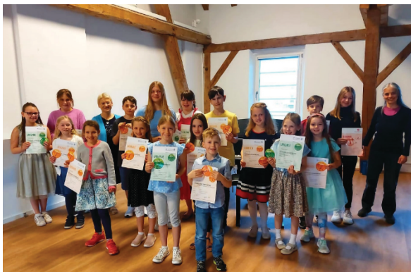
Juniorprüflinge im KOM

D1- und D2-Prüfungen absolvierten insgesamt 37 Teilnehmer. Hier musste neben dem praktischen Instrumentenvorspiel auch eine Theorieklausur bestanden werden. Die dafür online angebotenen Vorbereitungskurse waren ebenfalls besonders nachgefragt.