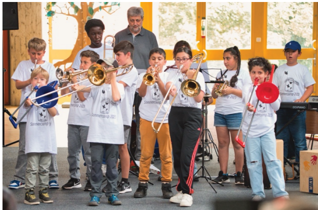
Bläserklassenkinder beim Puchheimer Sommercamp

Zu guter Letzt haben die Kinder nach Besuch einer Bläserklasse die Möglichkeit die örtliche Musikkapelle der Kommune tatkräftig zu unterstützen!