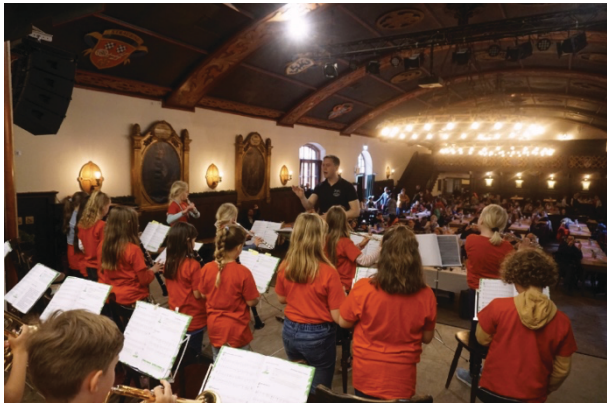
Bläserklasse aus Fürstenfeldbruck im Augustinerkeller München