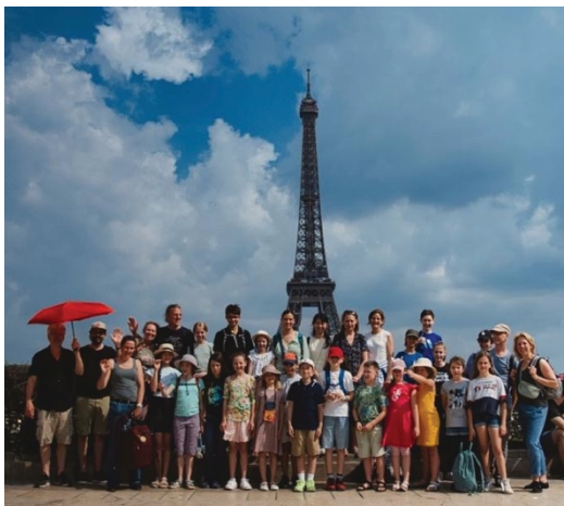
Schüler der KMS am Place du Trocadéro, Paris

Die Rückreise war gefüllt mit unvergesslichen Erinnerungen an eine Reise, die nicht nur die musikalischen, sondern auch die zwischenmenschlichen Grenzen überschritt. Der Austausch mit Livry-Gargan hat einmal mehr gezeigt, wie Musik Menschen unterschiedlicher Herkunft verbinden und Freundschaften über nationale Grenzen hinweg fördern kann. Die Kreismusikschule Fürstenfeldbruck sieht diesem Austausch als eine wertvolle Bereicherung für das musikalische und persönliche Wachstum ihrer Schüler und freut sich auf weitere musikalische Abenteuer in der Zukunft. Schreibe dass wir uns freuen im Jahr 2024 die Franzosen in ihrer Partnerstadt Fürstenfeldbruck begrüßen zu dürfen.