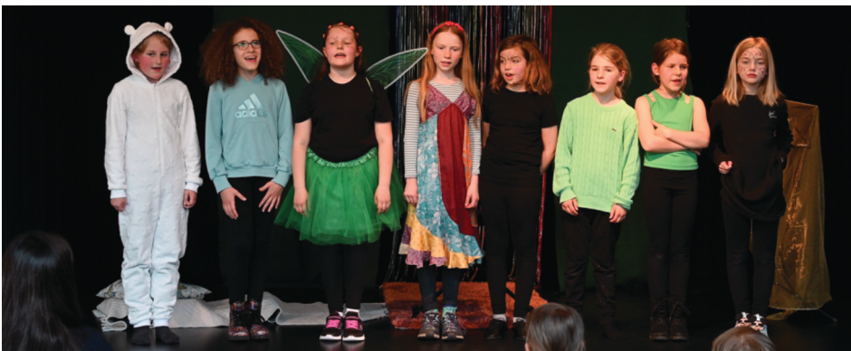
Kindermusical „Lily baut Mist“

Durch Marinos innovative Lehrmethoden, die sich durch einen praktischen, schulbuchfreien Ansatz auszeichnen, erleben die Schülerinnen und Schüler der "Musical Kids" einen einzigartigen Zugang zur Musik. Sie werden dazu inspiriert, bereits im ersten Unterrichtsjahr bedeutende musikalische Werke zu interpretieren und ihre kreative Ausdruckskraft voll zu entfalten.