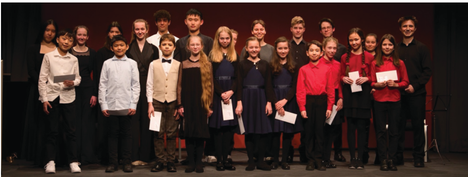
Gruppenbild vom Preisträgerkonzert „Jugend musiziert“

Die Erfüllung dieser hohen Standards und die Balance zwischen kommunalen Zuwendungen, Unterrichtsentgelten und Gehältern sind entscheidend für die finanzielle Unterstützung durch den Staat. Die KMS leistet einen wichtigen Beitrag zum kulturellen Leben der Mitgliedskommunen durch die Organisation von Konzerten, Auftritten und der musikalischen Begleitung bei kommunalen Veranstaltungen. Sie fördert musikalische Talente unter finanziell erschwinglichen Bedingungen und stellt ein umfassendes musikalisches Angebot für Bildungseinrichtungen und andere kulturelle Institutionen bereit. Darüber hinaus bietet die Musikschule den Gemeinden und Städten die Möglichkeit, das musikalische Leben entsprechend den lokalen Bedürfnissen mitzugestalten und zu bereichern.